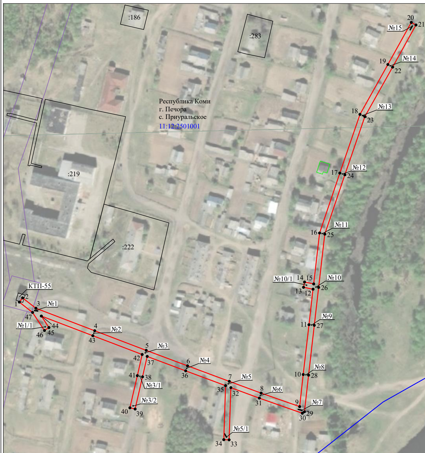
Схема расположения границ публичного сервитута объекта