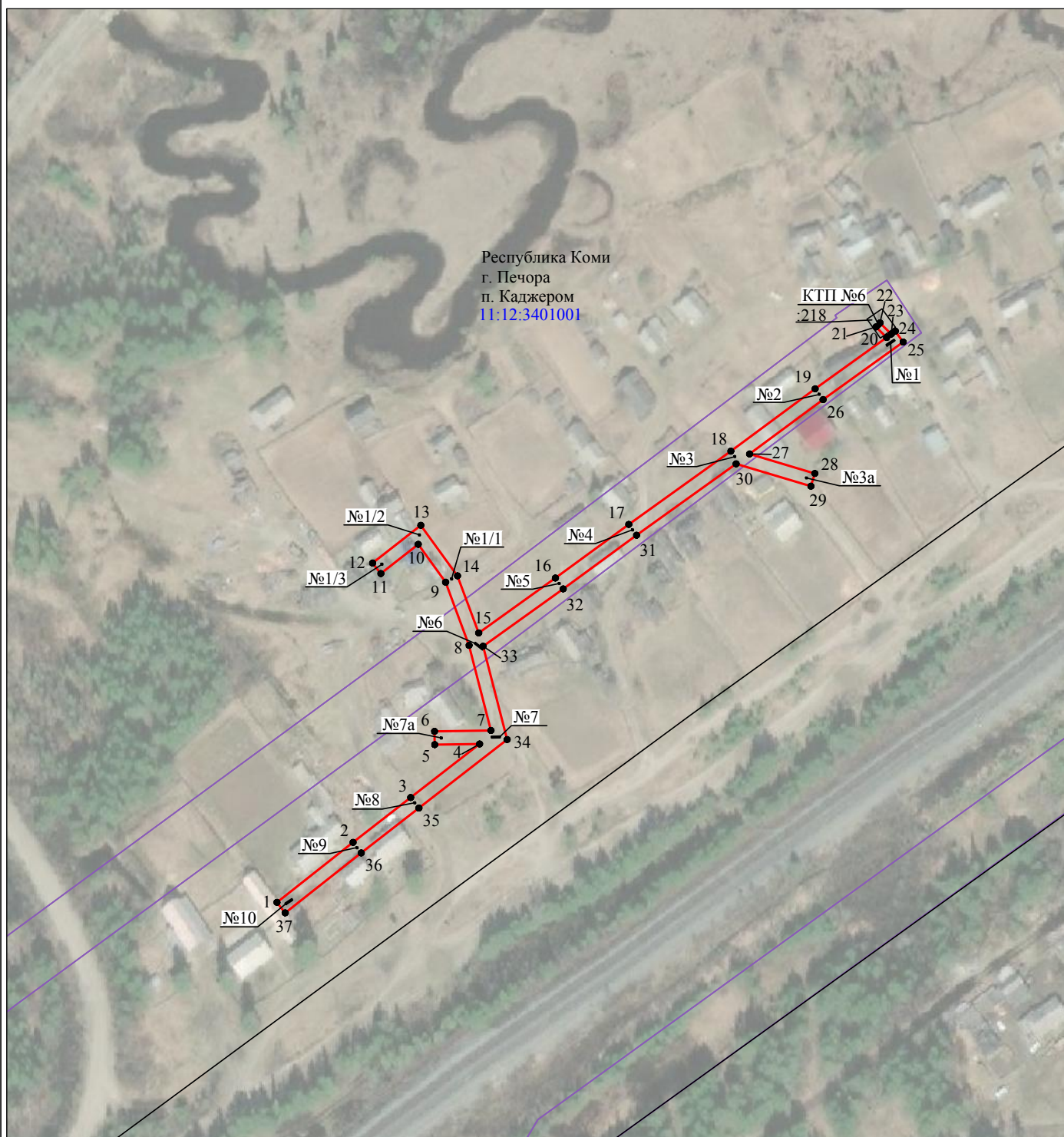
Схема расположения границ публичного сервитута объекта